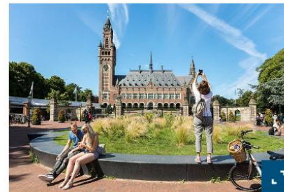
Der Internationale Gerichtshof verpflichtet Staaten zu wirksamem Klimaschutz.

Startseite > Aktuelles > Internationaler Gerichtshof sieht Menschenrechte vom Klimawandel bedroht